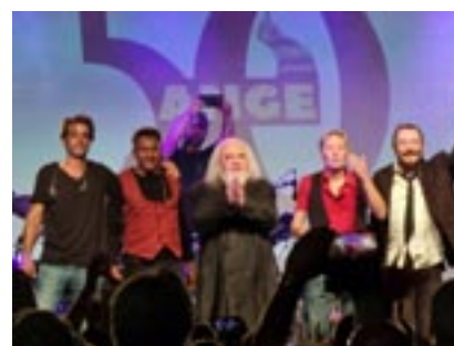
A Épinal le 19 août 2022

A N G E Groupe ○ fin 1969 Belfort (90) Groupe de rock progressif