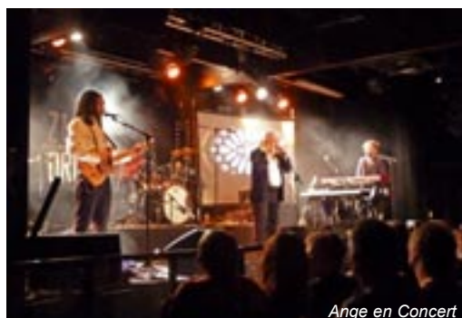
Ange en Concert

A N G E Groupe ○ fin 1969 Belfort (90) Groupe de rock progressif