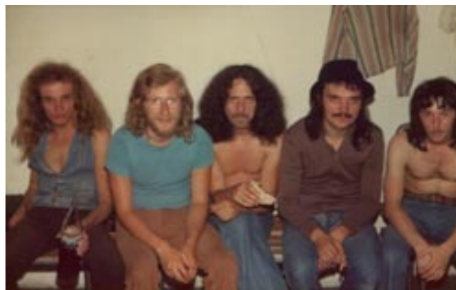
Le groupe ANGE en 1977