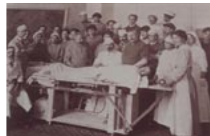
Avec son équipe à l'Hôtel-Dieu