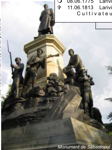
Monument de Sébastopol