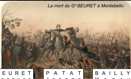
La mort du G ral BEURET à Montebello

Georges BEURET repose dans son village natal de Larivière où un monument surmonté de son buste a été érigé.