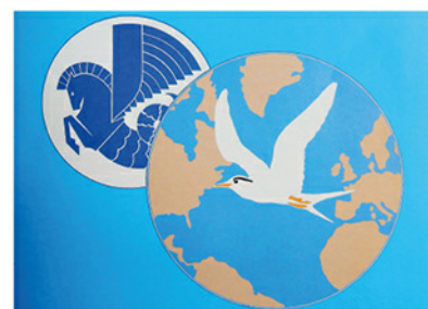
Logo Air France Transatlantique