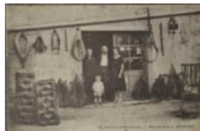
Bourrellerie Boudard à Trévilleurs