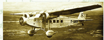
Bloch 120 au-dessus de Madagascar en 1938