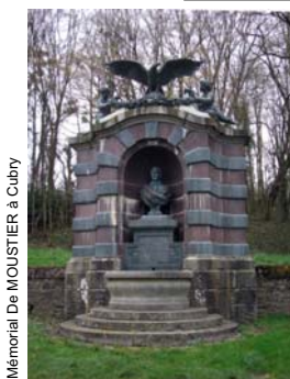
Mémorial De MOUSTIER à Cubry