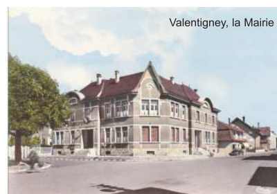
Valentigney, la Mairie