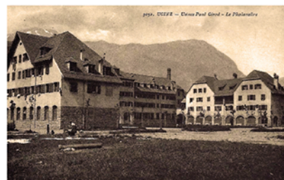
Le phalanstère d'Ugine (73) construit en 1910

FOURIER François Marie Charles ○ 07.04.1772 Besançon (25) † 10.10.1837 Paris (75) x FALLOT Sophie Léonie Philosophe économiste