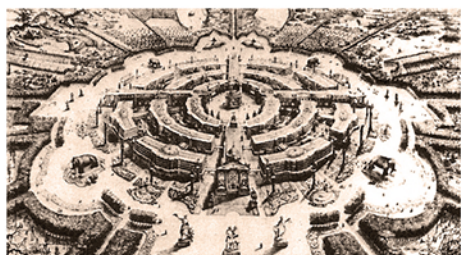
Un phalanstère vu par FOURIER

FOURIER François Marie Charles ○ 07.04.1772 Besançon (25) † 10.10.1837 Paris (75) x FALLOT Sophie Léonie Philosophe économiste