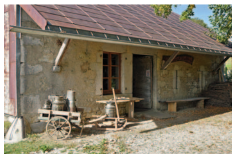
Le chalet du Coin d'Aval