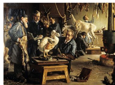
Partie de La Reconstitution du Dodo par l'Atelier du Professeur OUSTALET au Museum d'Histoire Naturelle de Paris