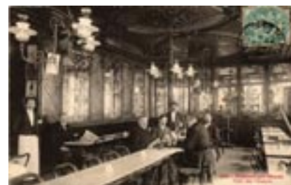
Café des oiseaux à Châlons-sur-Marne