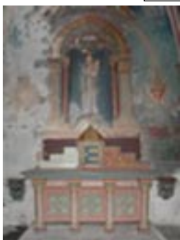
La Chapelle de Ségur