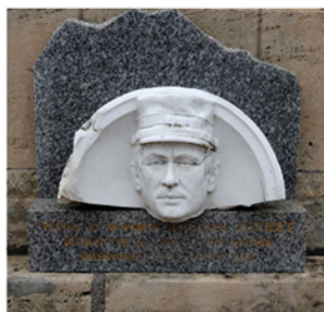
Monument aux Morts de Jonchery