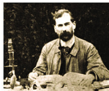
x 19.05.1823 Montécheroux (25)