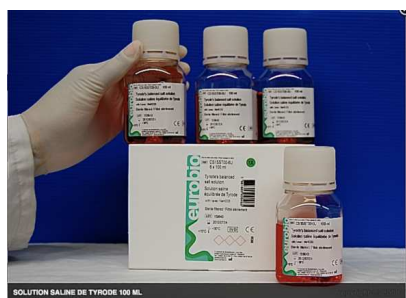
La solution de Tyrode

TYRODE Paul Octave Maurice ○ 06.11.1878 Besançon (25) † 04.06.1930 Boston (USA) x 1907 Boston (USA) CLEMENT Hélène F. Docteur en médecine Pharmacologue