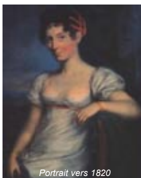
Portrait vers 1820