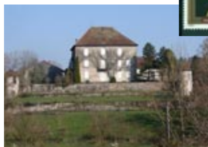
Le château de Moutonne