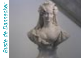
Buste de Dannecker