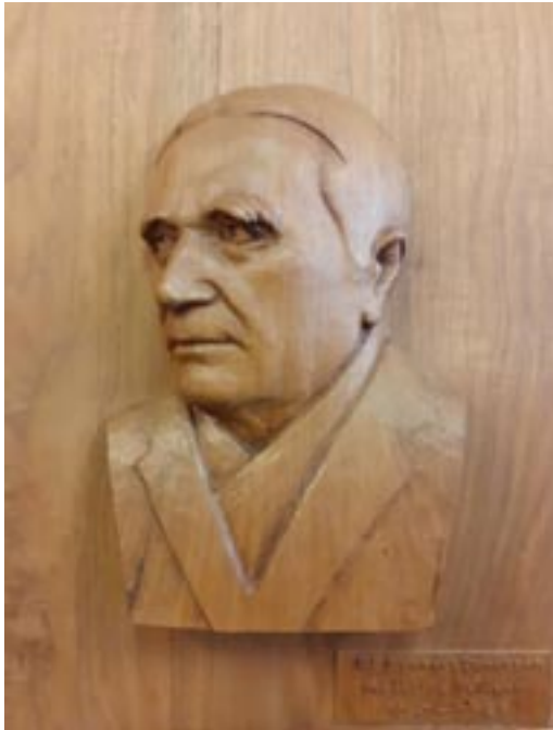
Statue en bois de Georges Curasson par Giroulet, sculpteur polinois au club qui porte son nom

Georges CURASSON est né à Poligny le 8 novembre 1889 et décédé à Poligny le 23 octobre 1970.