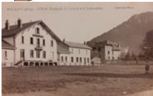
L'ENIL de Poligny et la villa du directeur