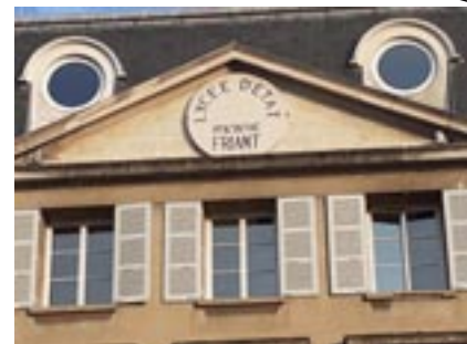
Le Lycée Friant à Poligny