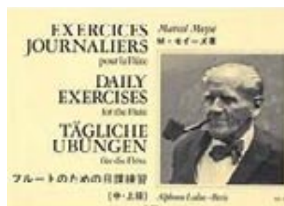
Un des nombreux livres d'exercices