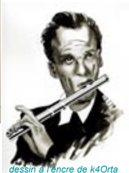
dessin à l'encre de k4Orta