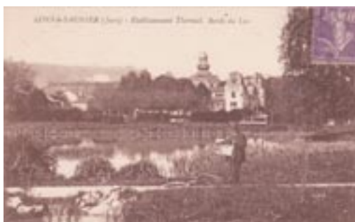
Le parc des bains