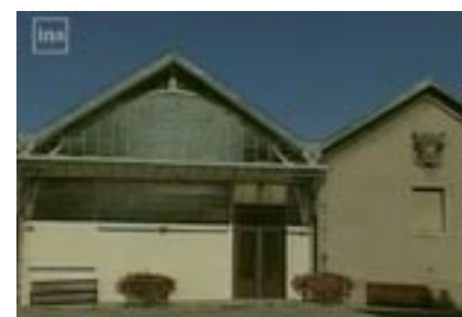
L'abattoir de Lons