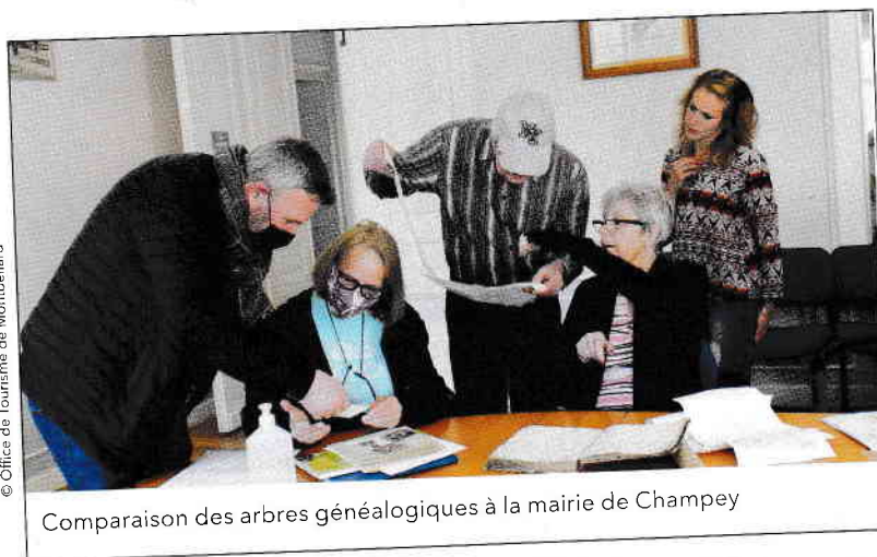
Comparaison des arbres généalogiques à la mairie de Champey

Grâce aux travaux de la Société d'émulation (SEM), des généalogistes du Centre d'entraide généalogique de Franche-Comté (CEGFC) et de la Société d'histoire et d'archéologie de l'arrondissement de Lure (SHAARL),